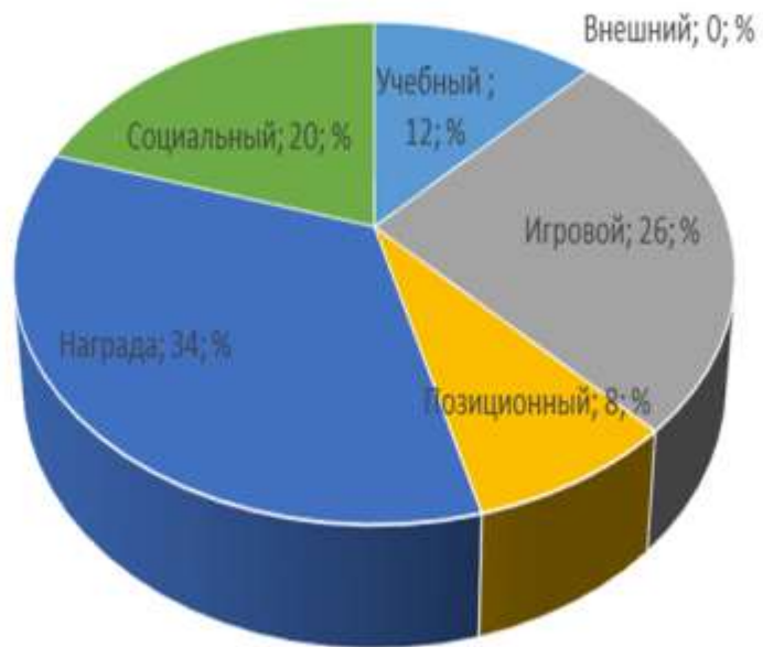
Результаты диагностики мотивации детей к занятиям по физкультуре. (октябрь 2023 г.)

■ Учебный ■ Внешний ■ Игровой ■ Позиционный ■ Награда ■ Социальный