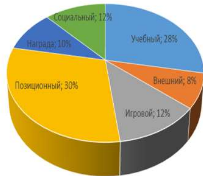
Результаты диагностики мотивации детей к занятиям по физкультуре ( май 2025г.)

■ Учебный ■ Внешний ■ Игровой ■ Позиционный ■ Награда ■ Социальный